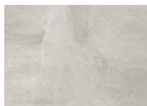
Beton Termoli 4)