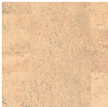
Jazz creme geölt