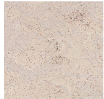
Salsa perlweiß geölt