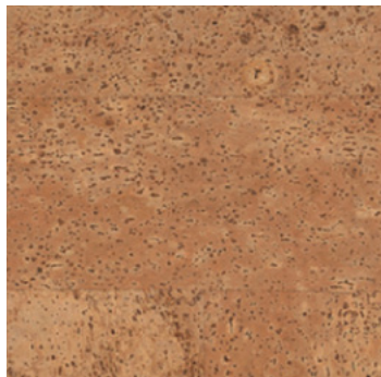
Noblesse natur geölt