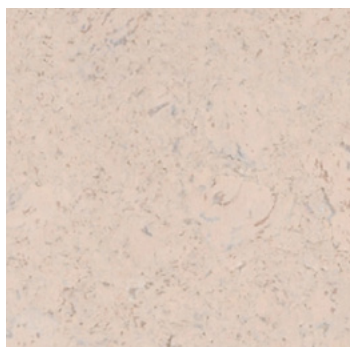
Arriba perlweiß geölt