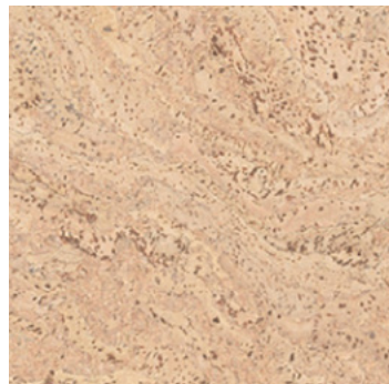
Salsa creme geölt