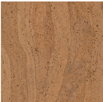
Swing natur geölt