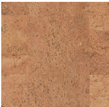
Jazz natur geölt