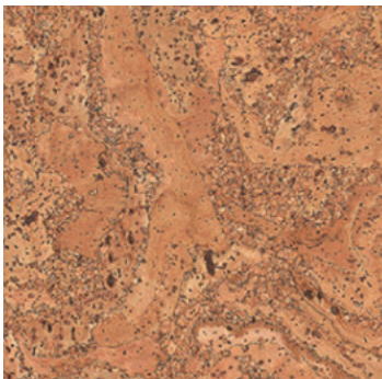
Salsa natur geölt