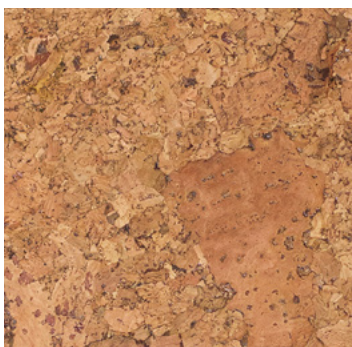
Arriba natur geölt