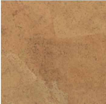
Harmony natur geölt