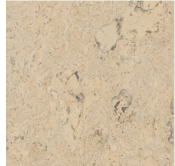
Rumba creme geölt