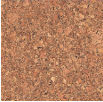
Classico natur geölt