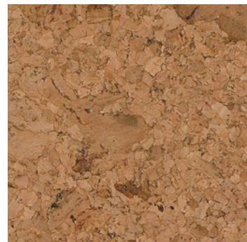
Nube natur geölt