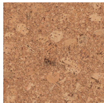
Tango natur geölt