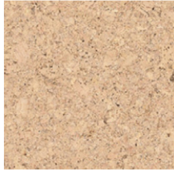
Classico creme geölt