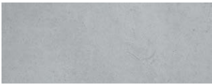
Cement Kreta 3)