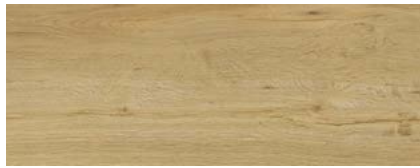
Eiche Woodstock 2)