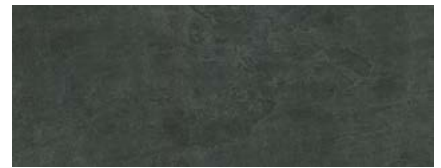
Basalt Korfu 3)