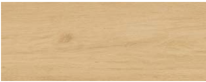
Erle Hartford 2)