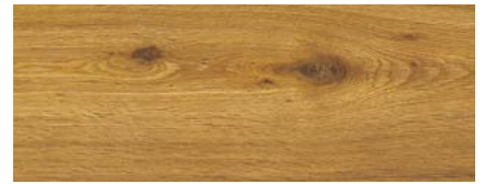
Eiche Madison 2)