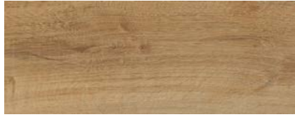
Ulme La Gomera 1)