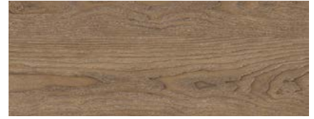
Eiche Dragonera 1)