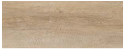
Kastanie Lanzarote 1)