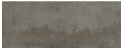
Riverstone Samos 3)