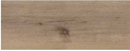
Eiche Gran Canaria 1)