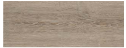
Eiche Teneriffa 1)