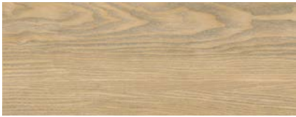
Eiche Cabrera 1)