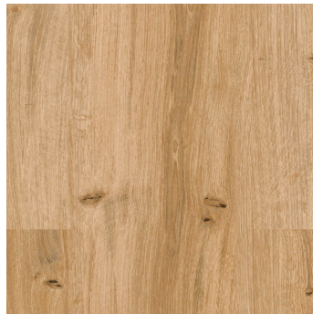
Amber Oak 1)