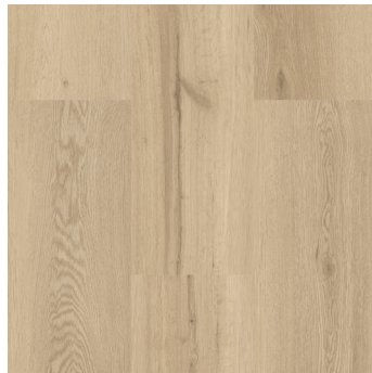
Sylter Eiche 2)