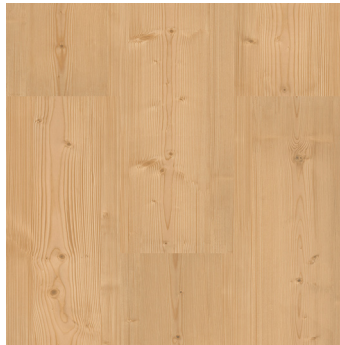
Lärche classic 2)