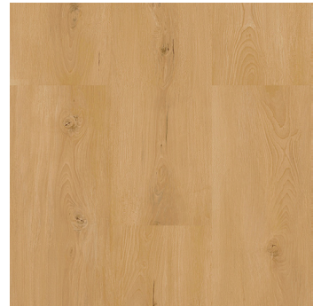
Rotbuche natur 1)