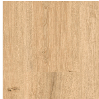
Gold Oak 1)