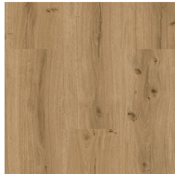
Glory Oak 1)