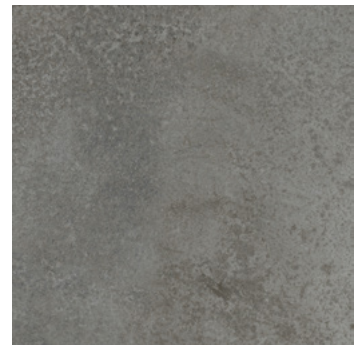
Beton Espoo super matt, strukturiert