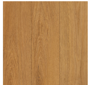
Wildeiche Ringsted *2) super matt, mit Synchronprägung