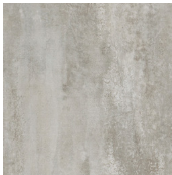
Cement Pori super matt, strukturiert