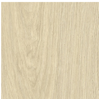
Wildeiche Nyborg *2) super matt, mit Synchronprägung