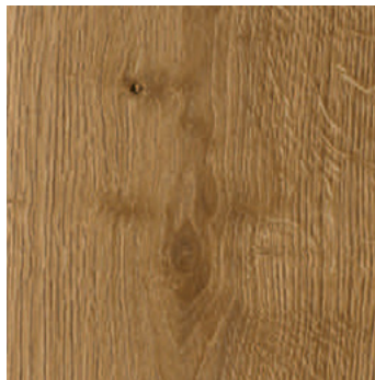
Natureiche Billund *1) super matt, mit Synchronprägung