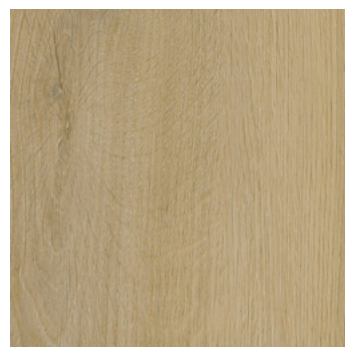
Helle Eiche Silkeborg