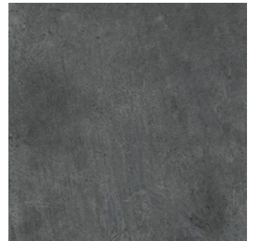
Terrasso Tampere super matt, strukturiert