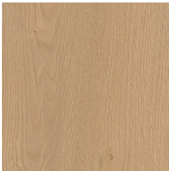
Eiche Helsinki *1) super matt, mit Synchronprägung