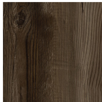
Dunkle Tanne Fano