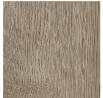
Eiche Lappland *1) super matt, mit Synchronprägung