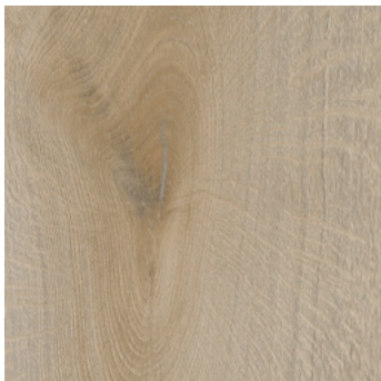
Eiche Harstad *2) super matt, mit Synchronprägung