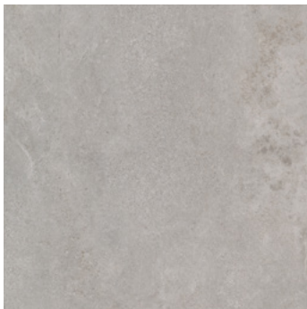
Kalkstein Kemi super matt, strukturiert