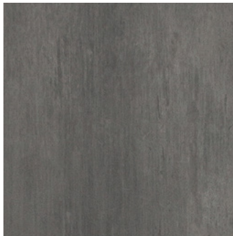
Fantasy Salo super matt, strukturiert