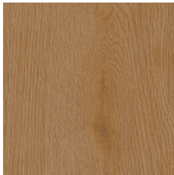
Eiche Viborg *2) super matt, mit Synchronprägung