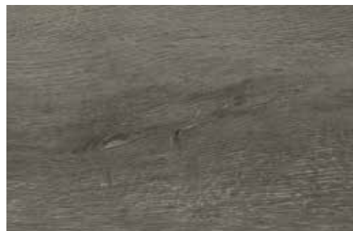
Črnika La Palma