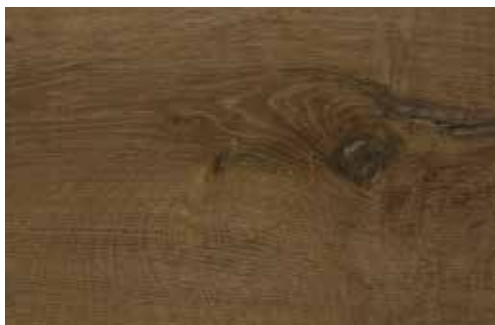
Brest La Gomera