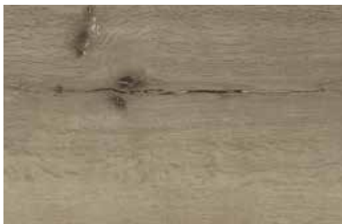
Hrast Gran Canaria