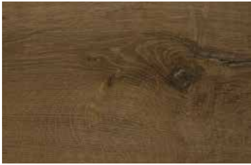
Ulme La Gomera