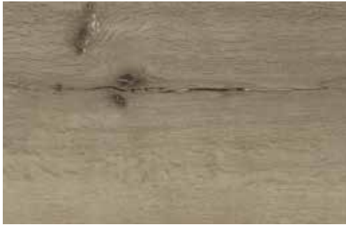
Eiche Gran Canaria