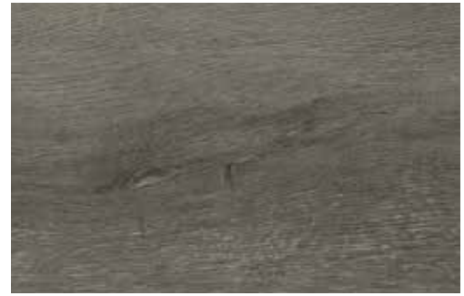
Steineiche La Palma