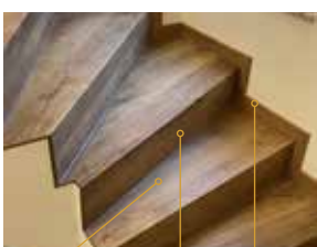
Trittstufe ohne Stoß Setzstufe (Stirnseite) im gleichen Dekor Mit passender Sockelleiste