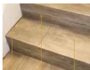
Mit Silikonfuge Setzstufe (Stirnseite) im gleichen Dekor mit Versatz Trittstufe mit Stoß