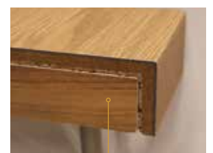
Stirnseite bei freistehender Treppe mit Klebefliese bzw. Holz-Deckschicht kaschiert.