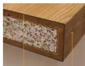
Komplette Ummantelung einer freistehenden Steinstufe ohne Blende. Kann nach Bedarf mit Vinyl oder Holzparkett abgedeckt werden.