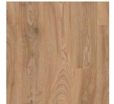
Oak Salerno - Synchronprägung