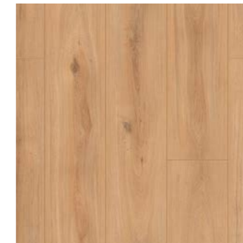
Oak Turin - Synchronprägung