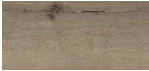
Chêne Gran Canaria