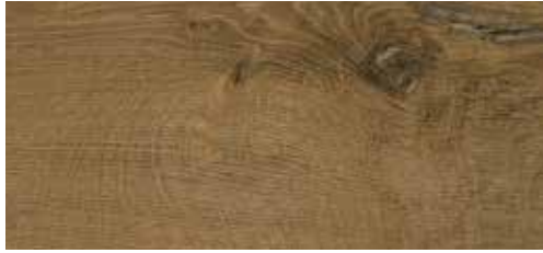
Orme La Gomera