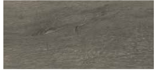
Chêne vert La Palma