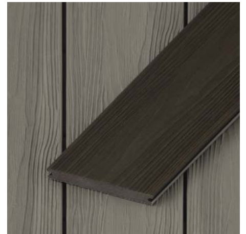
Coextrudierte Massivdielen | Walchensee 20 mm Höhe x 140 mm Breite Längen: 2700 | 3600 | 4500 mm