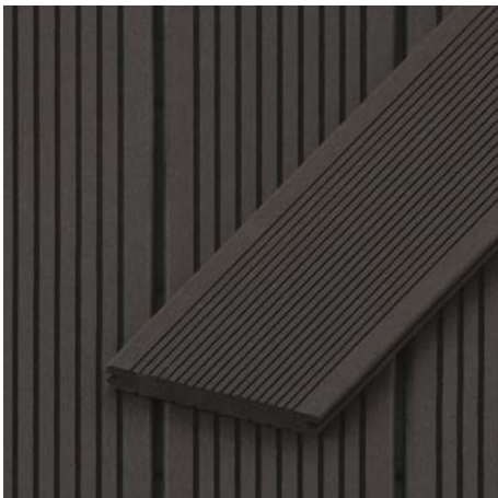
Massivdielen | Ammersee 20 mm Höhe x 120 mm Breite Längen: 2700 | 3600 | 4500 mm