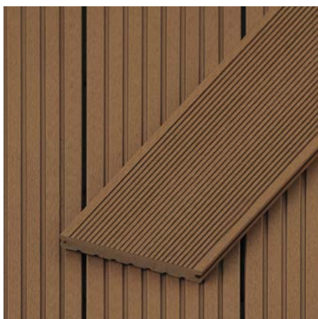
Massivdiele | Mummelsee 20 mm Höhe x 145 mm Breite Längen: 2700 | 3600 | 4500 mm