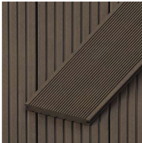
Massivdielen | Schluchsee 20 mm Höhe x 145 mm Breite Längen: 2700 | 3600 | 4500 mm