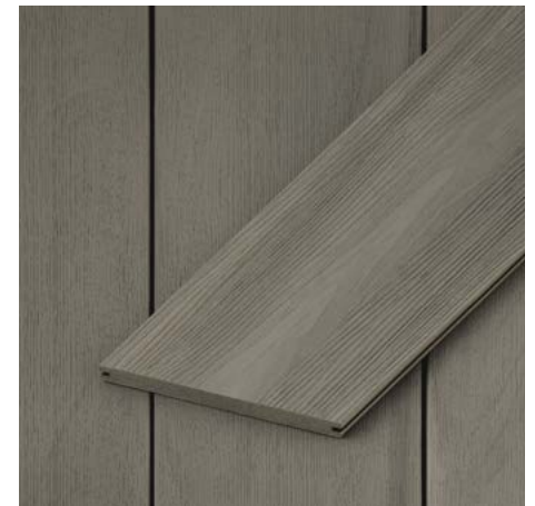
Coextrudierte Massivdielen | Starnberger See 20 mm Höhe x 210 mm Breite Längen: 2700 | 3600 | 4500 mm