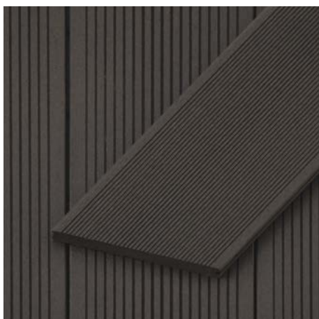
Massivdiele | Titisee 20 mm Höhe x 210 mm Breite Längen: 2700 | 3600 | 4500 mm