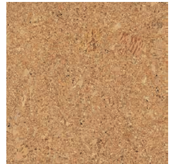
Cortina lverni, plaqué