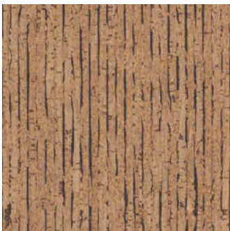
Mikado verni, plaqué