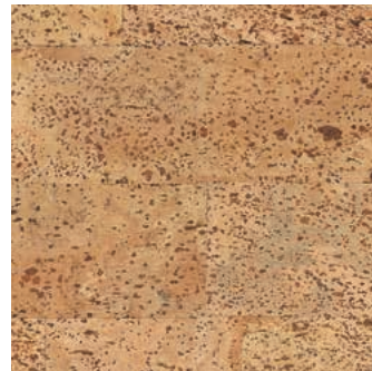
Capri 65 verni, plaqué