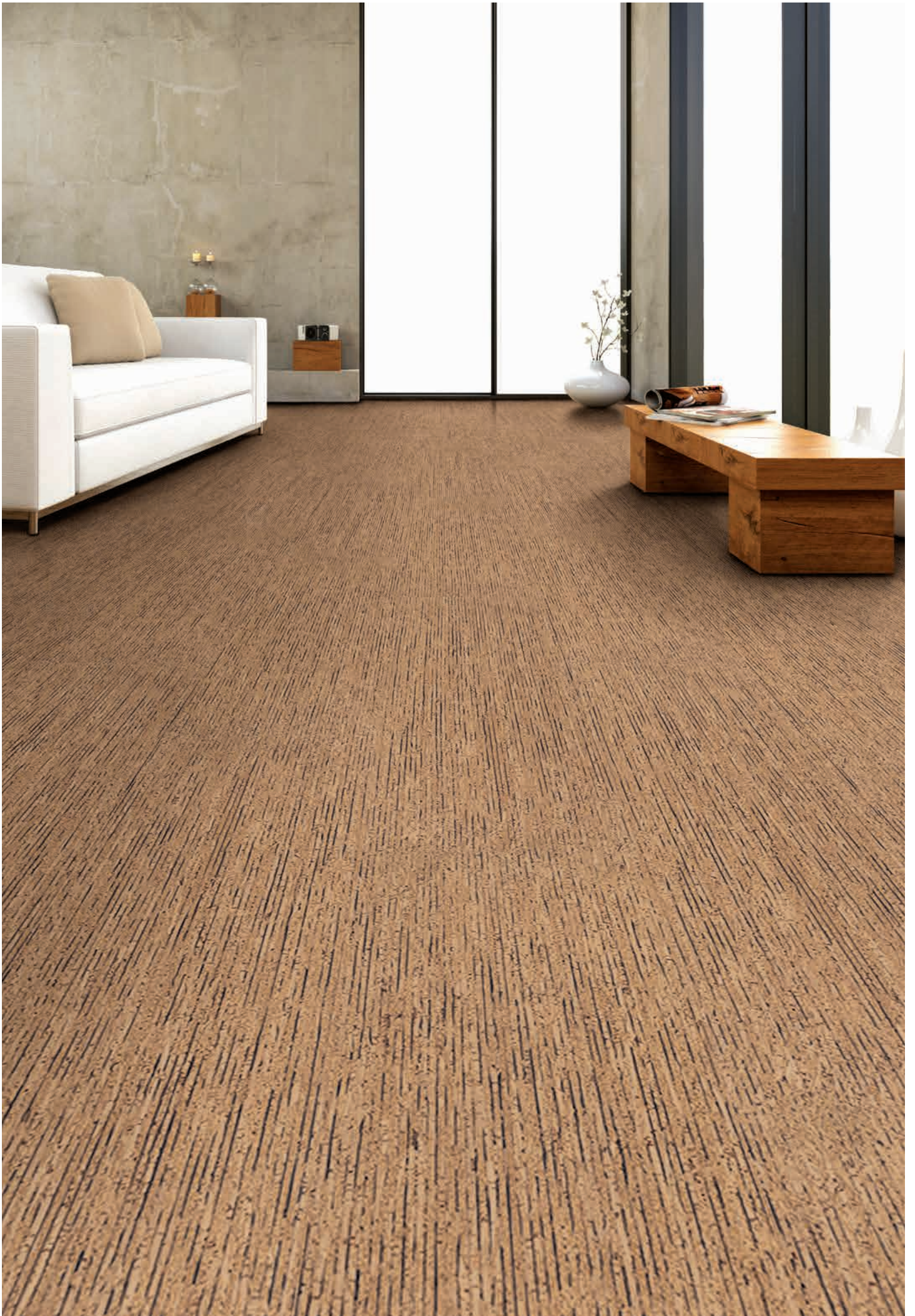
Sombra Kork | Mikado