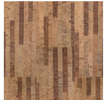
Strada verni, plaqué