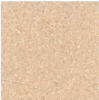
Mono creme verni, 2-couches