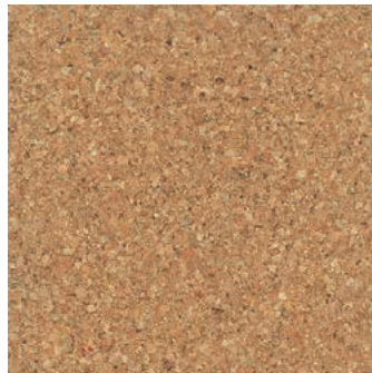
Mono verni, 2-couches