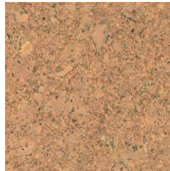
Solo verni, plaqué