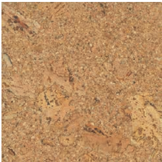
Nizza verni, plaqué